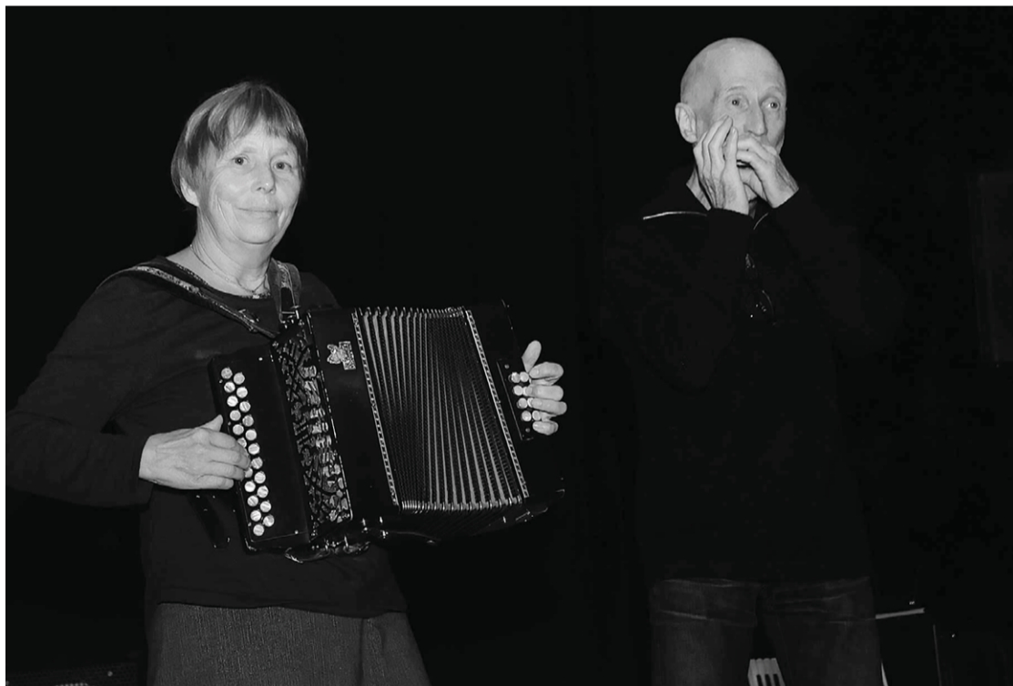
To trøndere spelte kjenslevart og dynamisk på toradar og munnspel. Salmen O store Gud var utruleg fin og publikum var med.