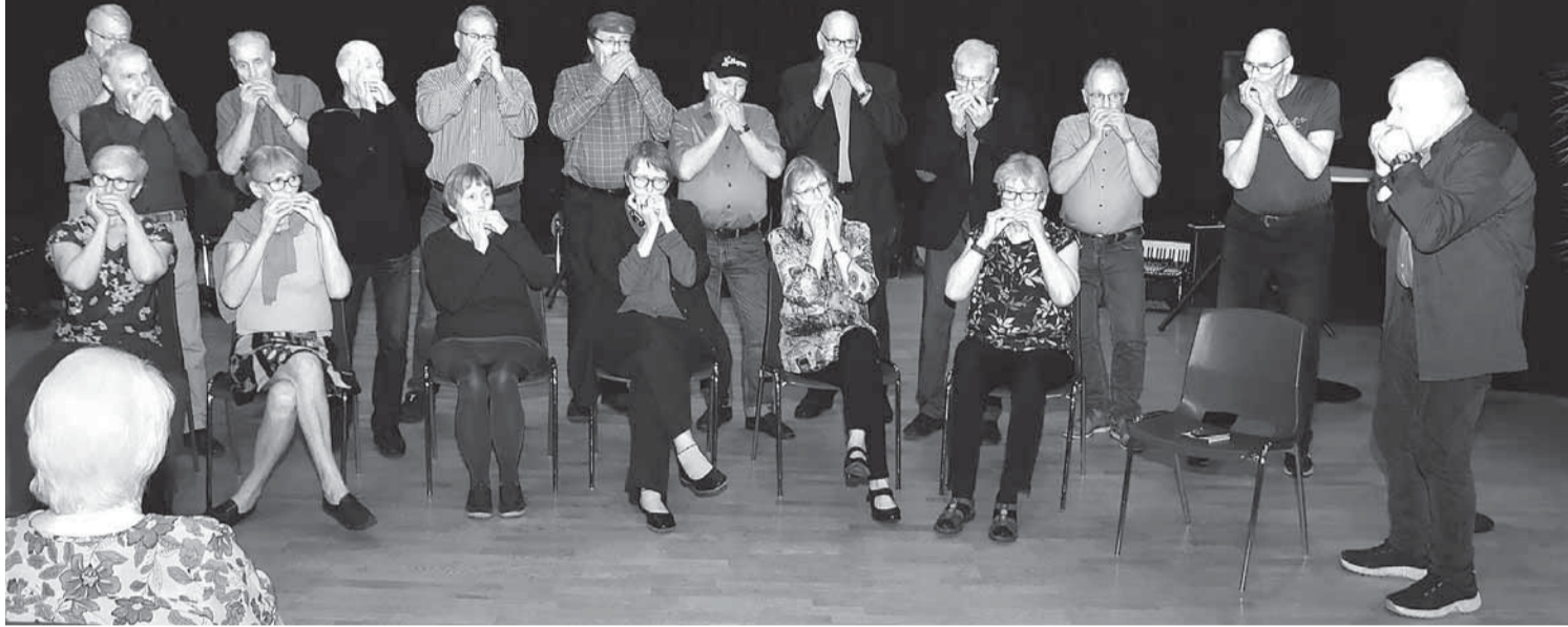
Alle som hadde vore med på kurset Tradisjonsmunnspel arrangerte i Valldal sist helg starta konserten på Martin Linge-huset med ein masurka.

KULTUR: Laurdag 26. august var det konsert med tradisjonsmunnspel for dei som ville høyre på Martin Linge-huset i Valldal.